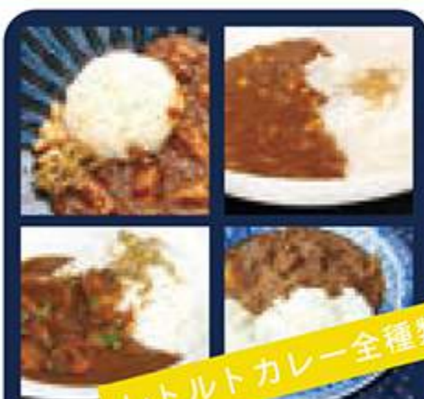
レトルトカレー全種類